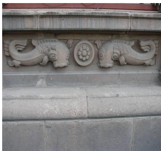
Фиг. 5 и 6. Декоративни сюжетни елементи, изработени от риолит