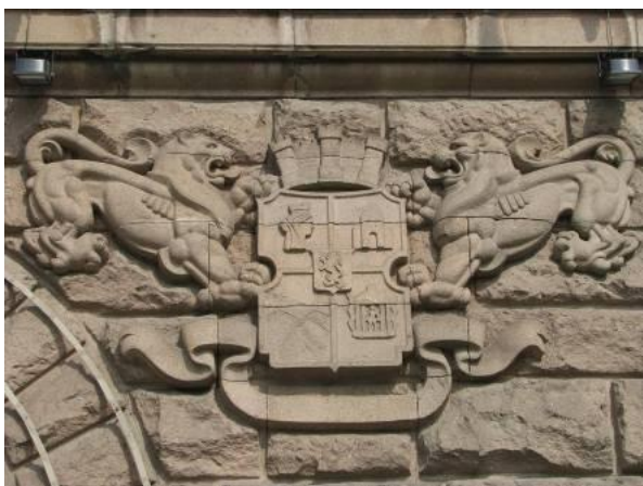
Фиг. 4. Елементи на националната символиката, изработени от риолит

Използването на материала от риолитовите находища за целите на сградостроителството, се е оказало целесъобразно и сравнително икономично решение при тогавашните следвоенни години. Друг пример на мащабно използване на риолита като строителен материал, от находищата от Пещерския, Пазарджишкия и Брациговски райони, е изграждането на Баташкия водосилов път и др. хидросъоръжения в района. През 70-те години на миналия век се разработва кариера "Лешниковци", от която например са произведени плочи за облицовка на фасадата на хотел "Рила" в столицата. Този материал не се подава на полировка, но се шлифова до степен "средно шлифоване" и благодарение на високата си декоративност, дължаща се на цветовия рисунък и ивичеста текстура, се явява едно оригинално архитектурно решение.