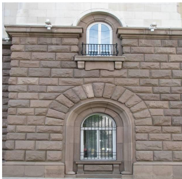
Фиг. 1. Дебелостенни облицовки на външните стени и цоклите на сгради в централната част на столицата, Министерския съвет

Във фасадите на тези сгради са използвани декоративни елементи от риолит, обикновено с кръгова форма и характерните за времето сюжети (фиг. 4, 5, 6).